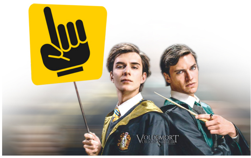
《哈利波特》的同人电影《伏地魔：传人的起源》曾被《哈利波特》版权持有者华纳兄弟以侵权为由提起诉讼，双方和解后，电影最终在YouTube免费播放。